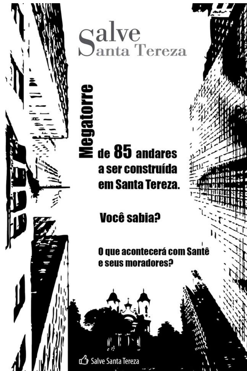
Img. 1 Panfleto de Ação: MSST.

[5] Essas torres estavam inacabadas devido à falência da construtora responsável pela obra e foram ocupadas por um grupo de pessoas até que, em 2010, um incêndio ainda não explicado deu origem a remoção das famílias que ali viviam.